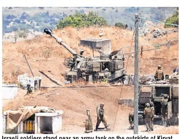
Israeli soldiers stand near an army tank on the outskirts of Kiryat Shmona near Israel's border with Lebanon on Thursday.

It was unclear who fired the rocket from Lebanon. Neither the Lebanese army nor the peacekeeping mission known as UNIFIL immediately commented on the explosions.