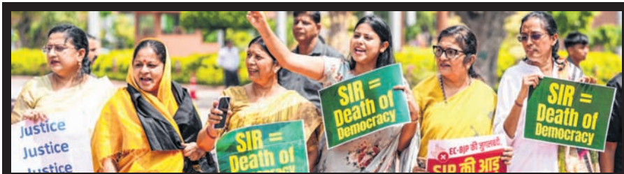
Opposition MPs hold a protest over the Special Intensive Revision (SIR) of Electoral Rolls in Bihar, during the Monsoon session of Parliament, in New Delhi

Priyanka criticised the Centre for avoiding discussions on Opposition-raised issues. She expressed surprise at disruptions originating from the treasury benches in the last session, suggesting they instigate reactions to create "hungama" and adjournments. She implied the government might be using these disruptions to avoid ac-